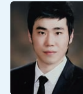
강남 정택권 지점장 2009.9월 위촉 열정, 근성, 끼 그리고 올바른 인성을 가졌다면 문제없습니다.