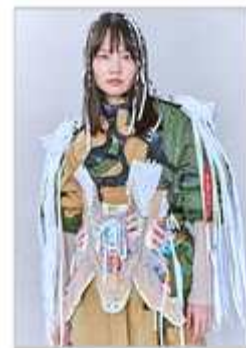
- 패션디자인학과 학생 작품