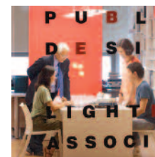
Graduate School of Design