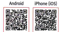
* Electronic billing