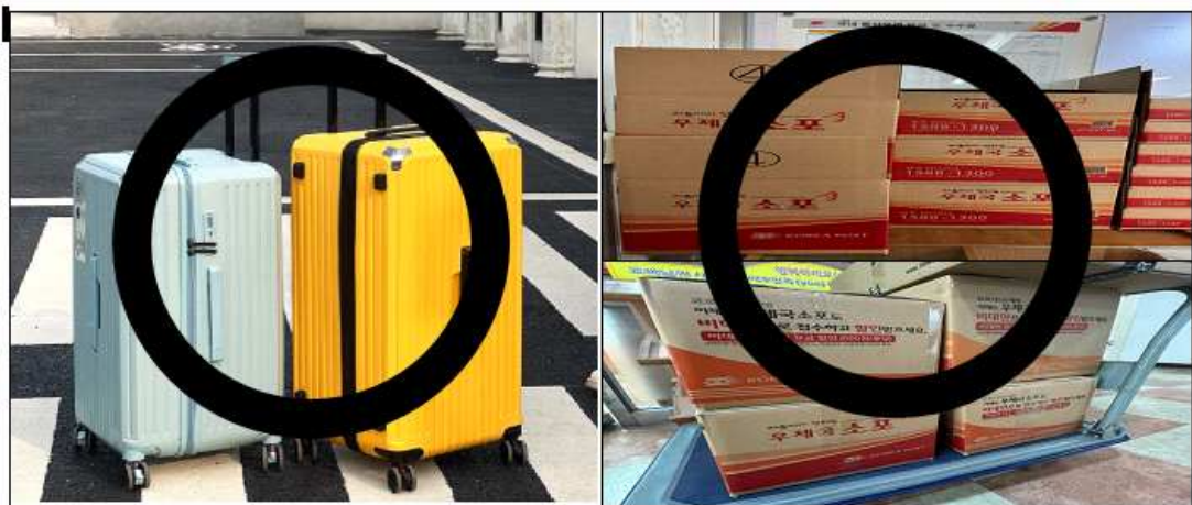
Vali và thùng giấy có thể bảo quản