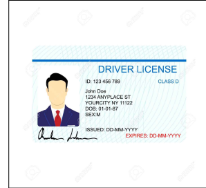
운전 면허증 driver license