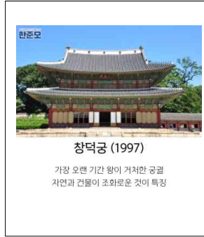
창덕궁 (1997) 가장 오랜 기간 왕이 거처한 궁궐 자연과 건물이 조화로운 것이 특징