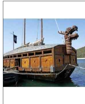
거북선 the Turtle Ship