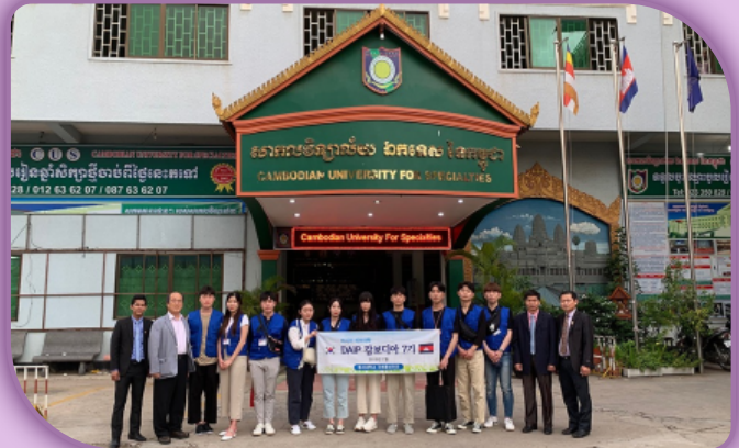
[DAIP 캄보디아 7기 프로그램]