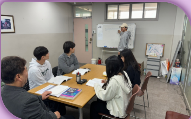
[ASK 연구회 비교과 프로그램]