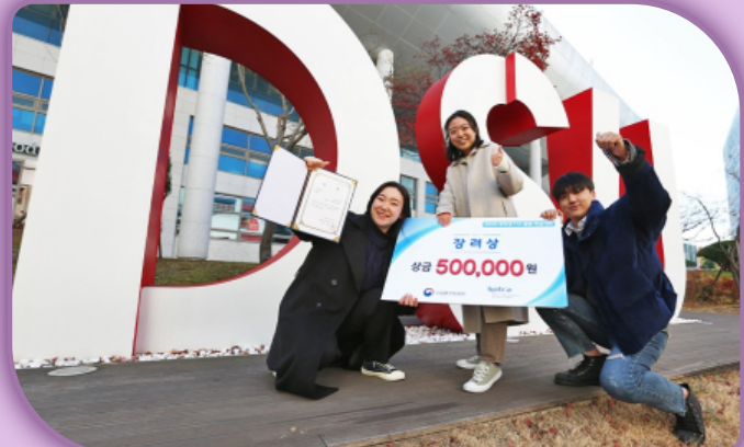
[대학생 FTA 활용 학술대회 '장려상' 수상]