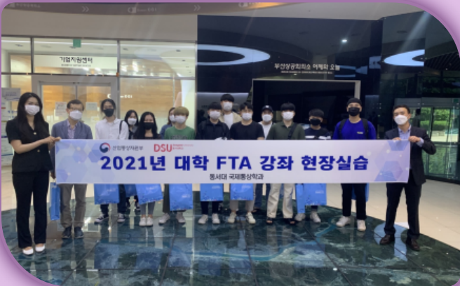
[대학 FTA 강좌 현장실습]

국제통상학과는 과거 10년 동안 정부로부터 FTA 활용지원 사업을 수혜를 받아오면서 FTA 전문 인력 약 500명 이상을 양성해 왔으며, 현재 <FTA활용실무> 강좌가 운영되고 있다.