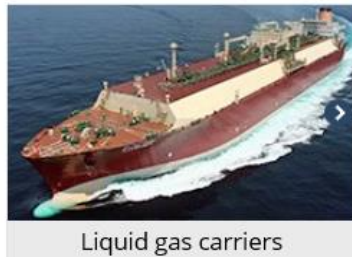
Liquid gas carriers