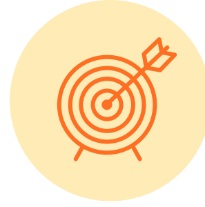
전장 제품 신뢰성 평가