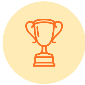
전장 제품 SW 검증

System SW 안정성과 신뢰성 확보를 위한 SW 검증/평가, 시뮬레이터 개발과 검증 자동화를 위한 개발등을 수행하며 이에 대한 축적된 경험을 기반으로 자동차 검증 평가 부분에 우수한 경쟁력을 확보하고 있는 기업입니다.