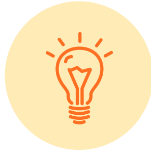
전장 제품 SW 개발